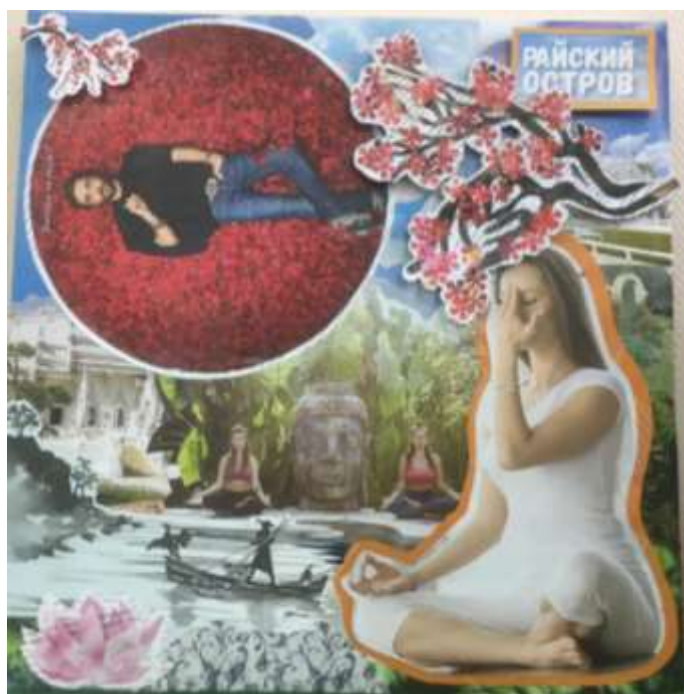
«Путешествие на Восток»