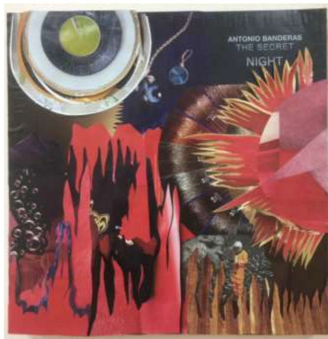
«На далёкой планете»