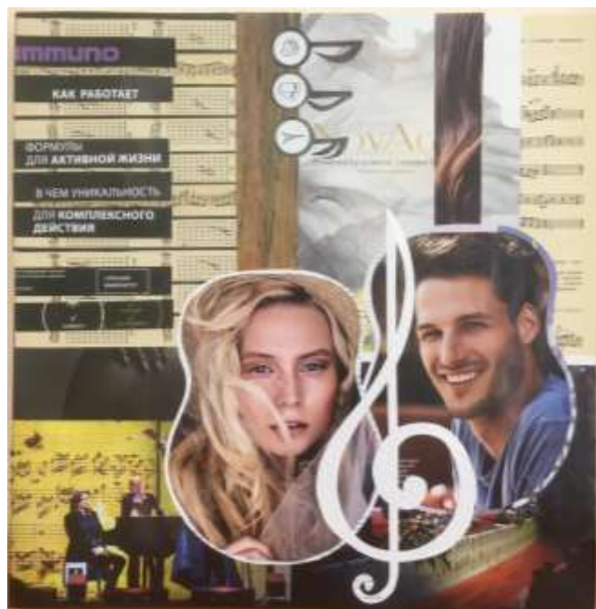
«Музыка для души»